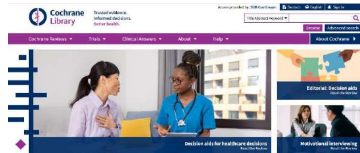
Screenshot unter Verwendung eines Bildes von D.Härter – CC BY-NC-ND 3.0

enthält Zusammenfassungen ausgewählter Cochrane Reviews