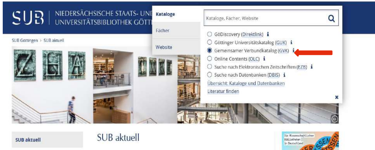
Screenshot unter Verwendung eines Bildes von D.Härter CC BY-NC-ND 3.0

Eure Suche könnt Ihr im GVK ausdehnen und im gesamten Bibliotheksverbund recherchieren. Hier ist es auch möglich, ggfs. Bücher und Zeitschriftenaufsätze per Fernleihe zu bestellen.