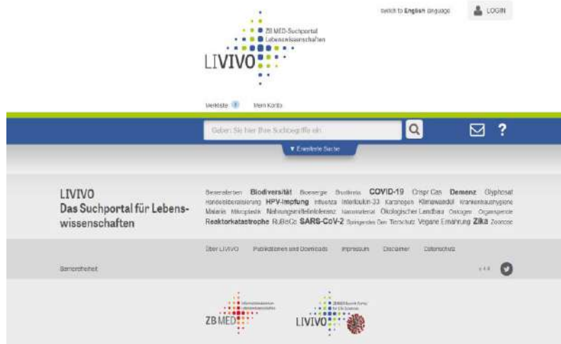
Screenshot unter Verwendung eines Bildes von D.Härter – CC BY-NC-ND 3.0

Hinweis: geht für die Recherche immer über die Startseite der SUB. Nur so ist gewährleistet, dass Euch als Angehörige der Uni Göttingen alle Möglichkeiten der Volltextnutzung angezeigt werden!